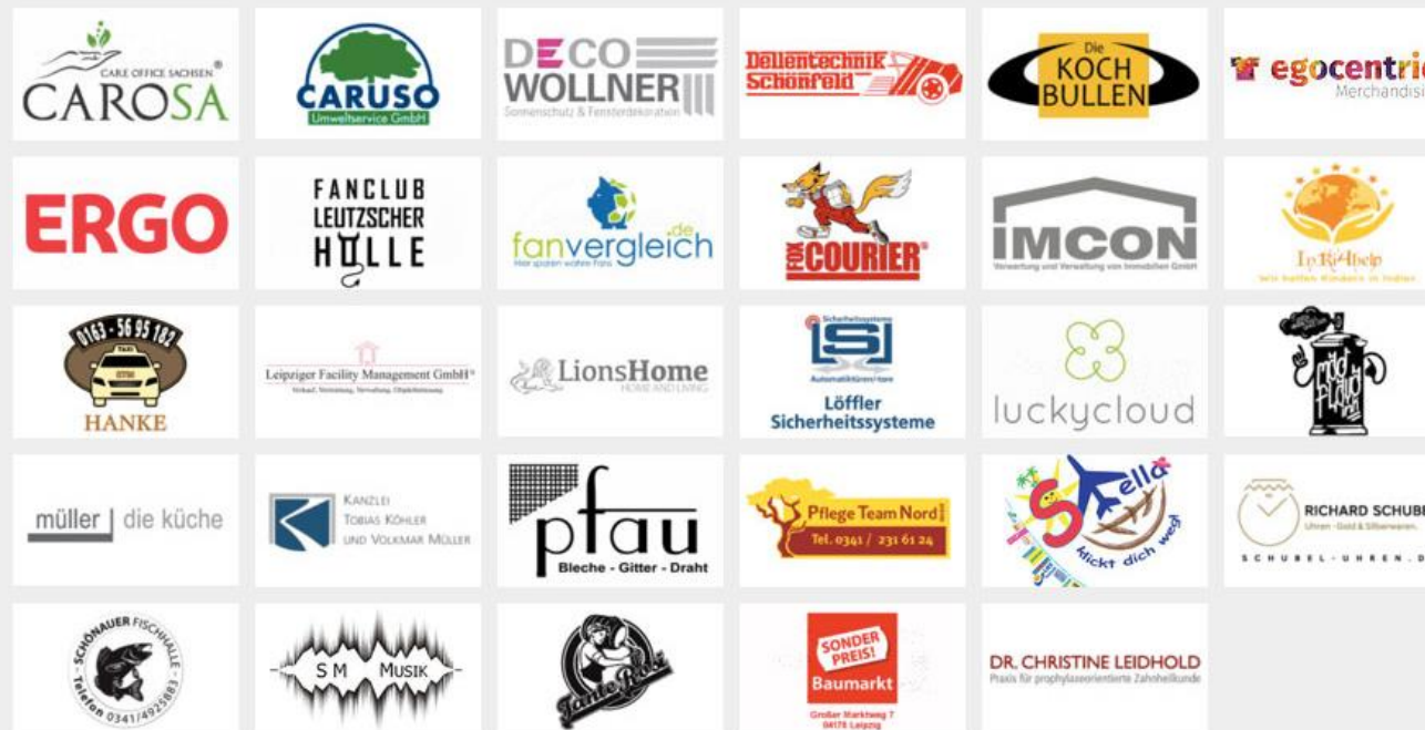
Foto: So werden unsere Partner samt Verlinkung auf unserer Homepage dargestellt.