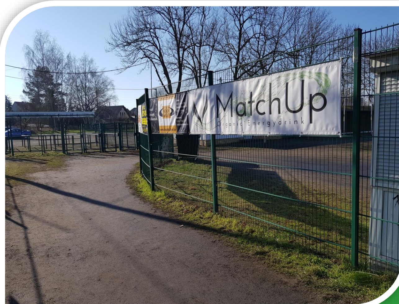
Foto: Über 2/3 der Fans gelangen über den Haupteingang ins Stadion – Die ideale Werbefläche für Ihr Unternehmen