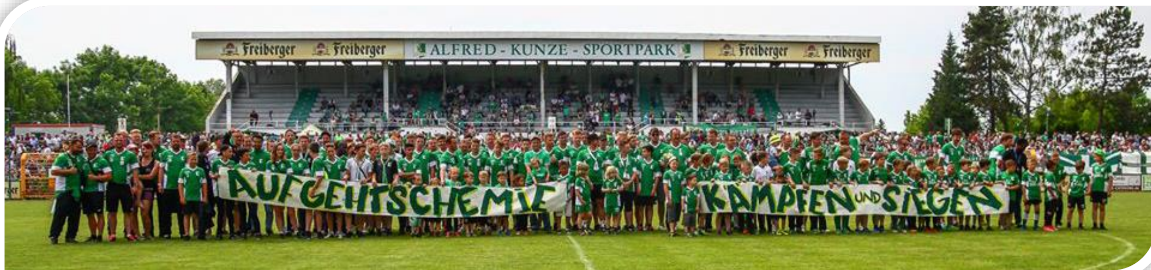
Foto: Der Grün-Weiße Nachwuchs – Immer mehr Kinder entdecken ihr Herz für Chemie.