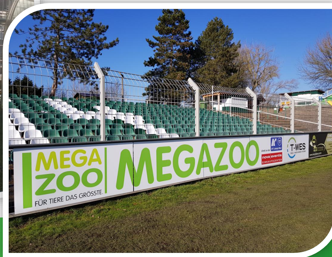
Foto oben: Im Fanbereich sind Sie im Sichtfeld von 90 % der Zuschauer – beste Voraussetzungen für lokale Unternehmen

Foto unten: Überregionale Unternehmen können Ihre Werbung im Fernsehbereich platzieren. Die Spielzusammenfassungen im mdr verfolgen durchschnittlich 140.000 Zuschauer