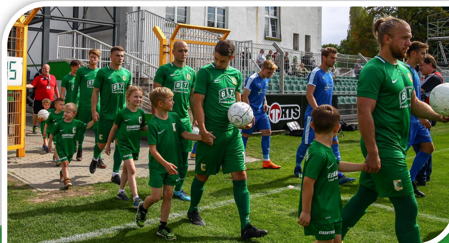
Foto: Unsere Spieler beim Einlaufen mit den signierten Fanbällen